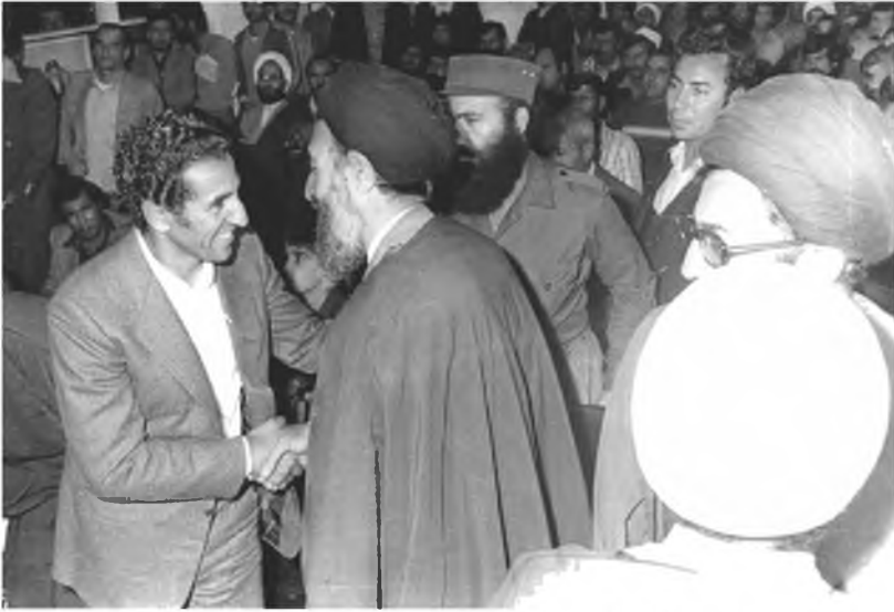
لقاء بين عبد السلام جلود والسيد محمد بهشتي في طهران، إيران، 1979.